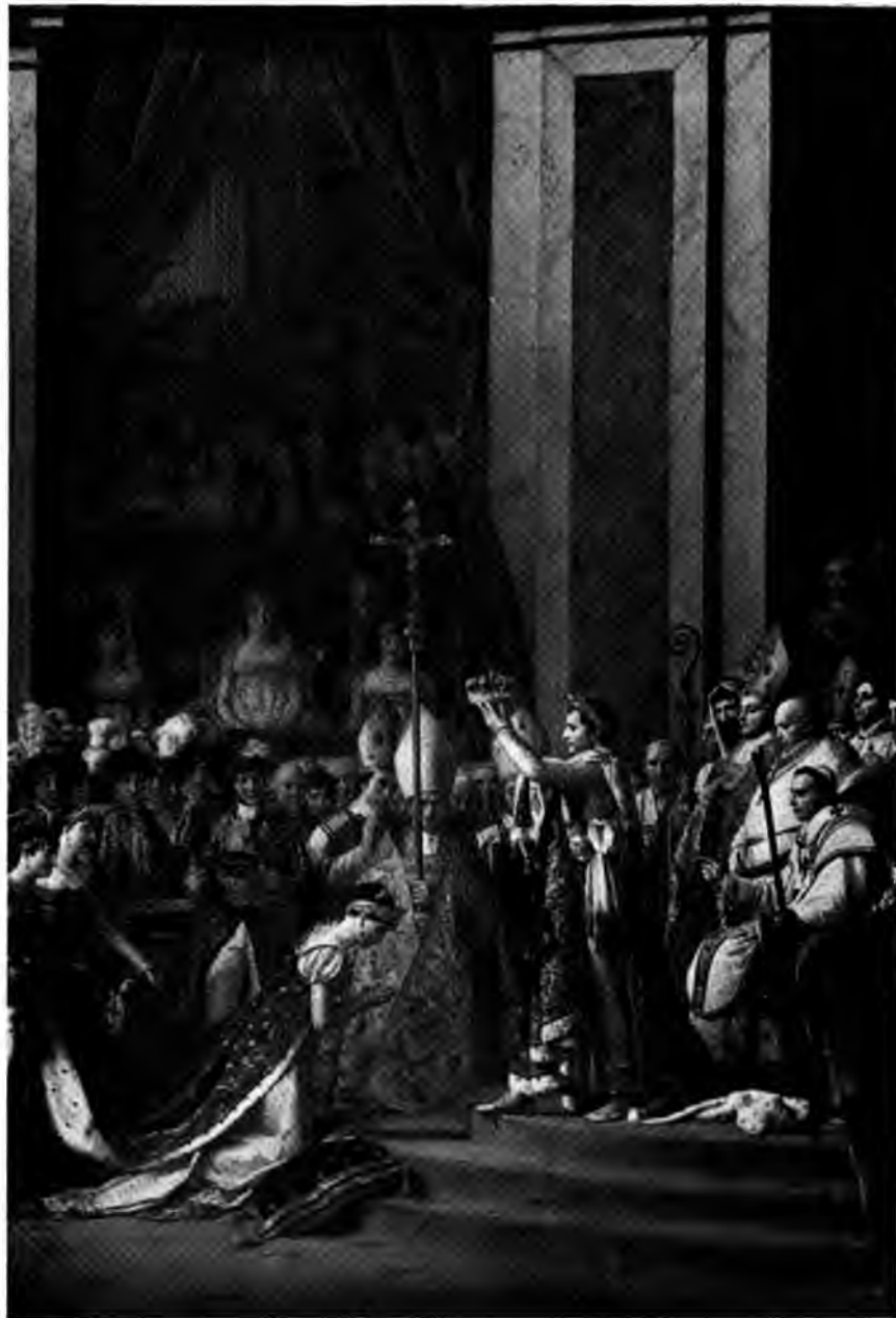
LE SACRE par David.